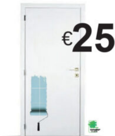
PORTE À PEINDRE AVEC TROU POUR SERRURE - TRYS Existe en largeur 68, 73, 78 ou 83 cm. Hauteur 201,5 cm. Porte livrée non finie. Ex. 83 cm. Réf. 24625,00